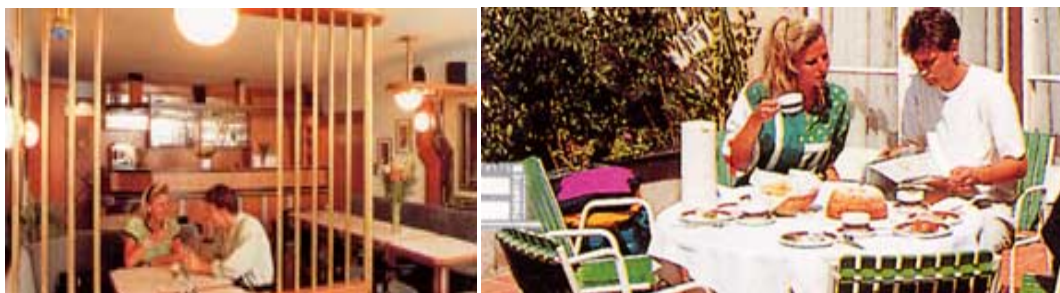
Jídelna a letní terasa