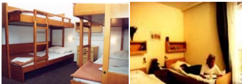
Čtyřlůžkový a dvoulůžkový pokoj