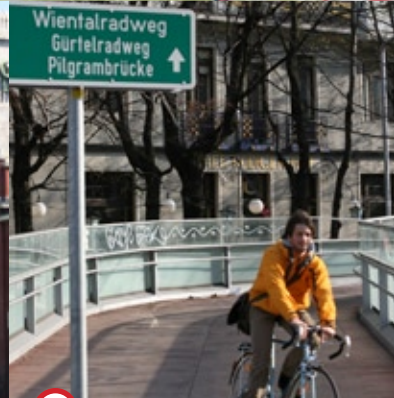
1 >>Anbindung Purkersdorf